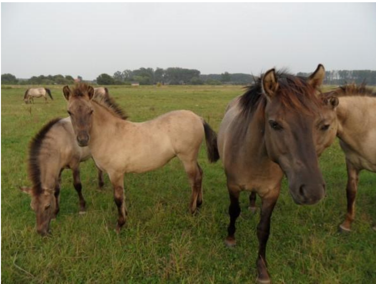
De paarden dachten al dat we ook in hun wei kwamen grazen