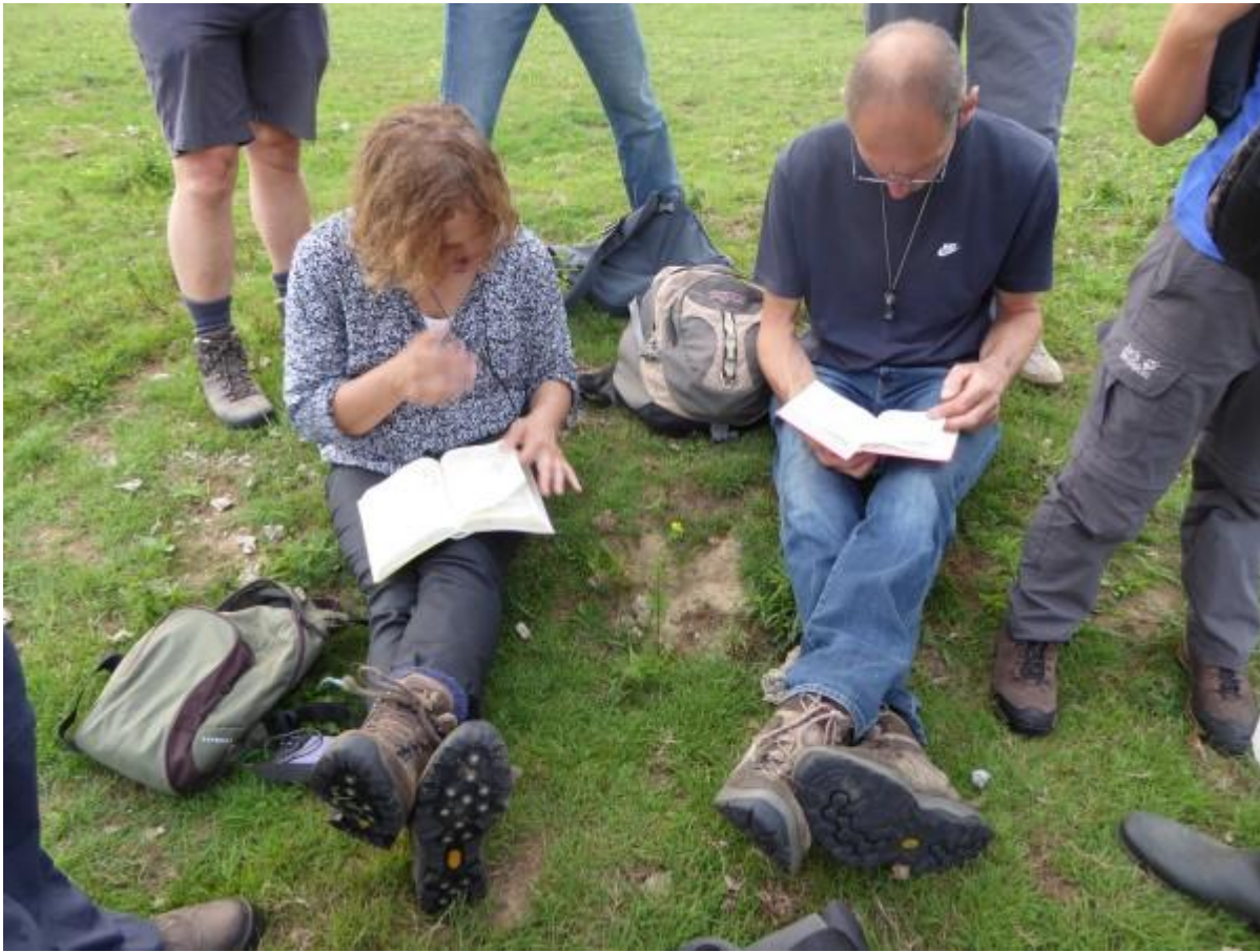
Zo gaat het natuurlijk voor geen meter vooruit!